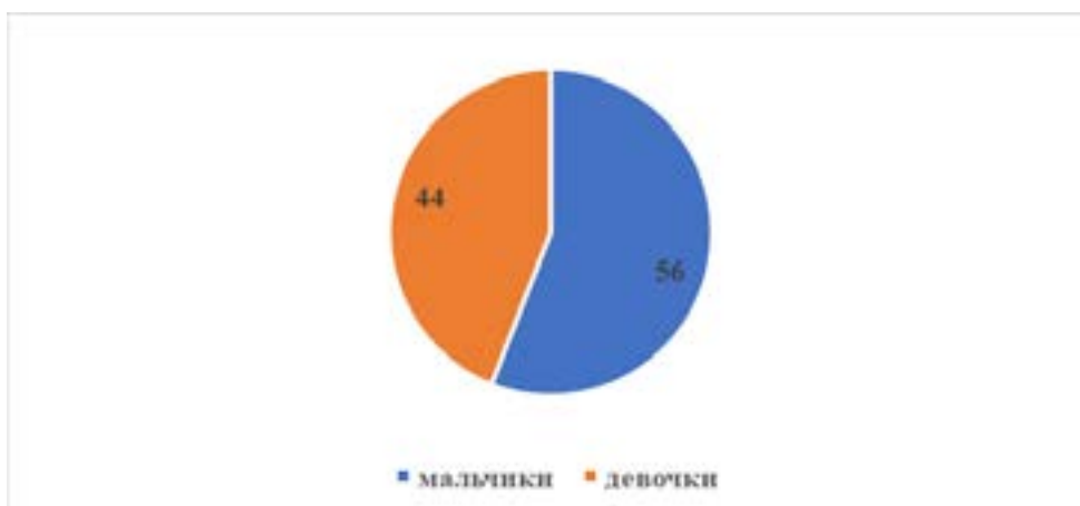
Рисунок-2. Распределение дети по полу.

Средний возраст обследованных составил 4,2 \pm 1,1 года (медиана — 4,0 года). Среди участников было 28 мальчиков (56%) и 22 девочки (44%)(рис.2). При анализе анамнестических данных установлено, что существенное влияние на частоту и тяжесть бронхолегочных заболеваний у детей оказывает комплекс внешних и внутренних факторов, способствующих снижению иммунологической реактивности организма. Одним из значимых неблагоприятных факторов является пассивное курение, которое отмечалось у 22 детей (44%) в 1 группе, во 2 группе - 15 (30,0%) детей и в 3 группе 10(20,0%) детей находились под влиянием пассивного курения. Известно, что воздействие табачного дыма на детей приводит к повреждению реснитчатого эпителия дыхательных путей, повышенной секреции слизи и нарушению местных защитных механизмов. В результате увеличивается частота острых респираторных инфекций и эпизодов бронхообструкции, а также формируется хроническое воспаление слизистых оболочек дыхательных путей.