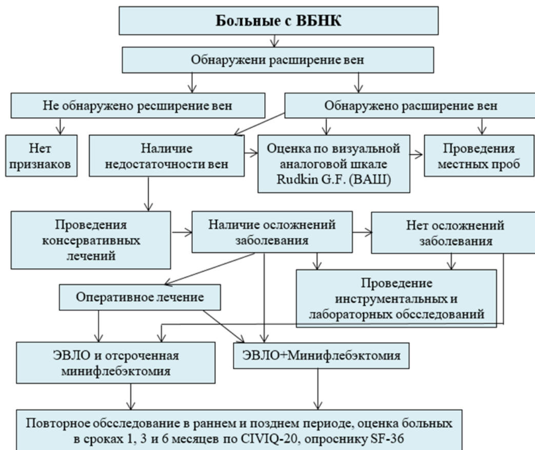
Рисунок-2. Алгоритм диагностики и лечения больных третьей группы.

Тактика диагностики и лечения больных третьей группы проводили по алгоритму диагностики и лечения приведенного в рисунке 2.